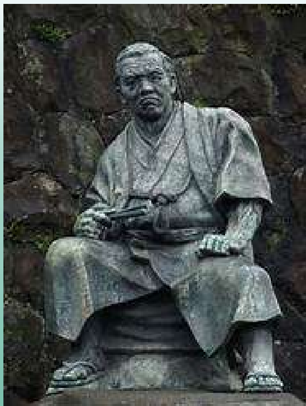
【梅蔭禅寺：次郎長翁銅像】